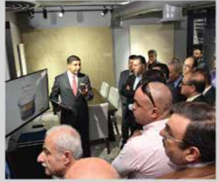
افتتاح معرض جوتن - الشركة العالمية للدهانات