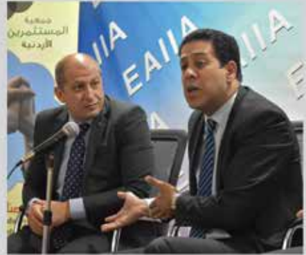
لقاء مدير الغذاء مع الصناعيين - شرق عمان