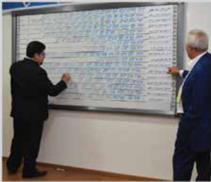
انتخابات مجلس إدارة الجمعية للدورة الثالثة