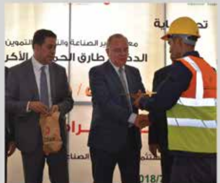
معرض التشغيل الصناعي الثالث - شرق عمان