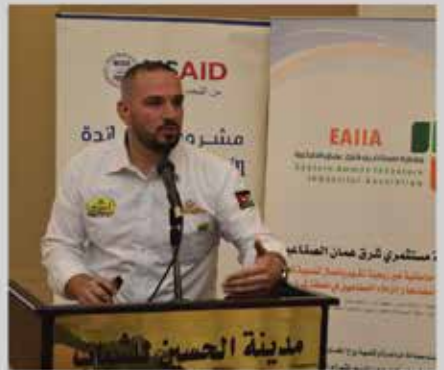
مؤتمر واقع الصناعة ومستقبل التغيير