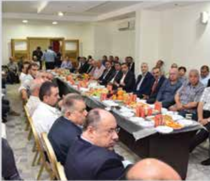
حفل المعايدة بمناسبة عيد الفطر السعيد