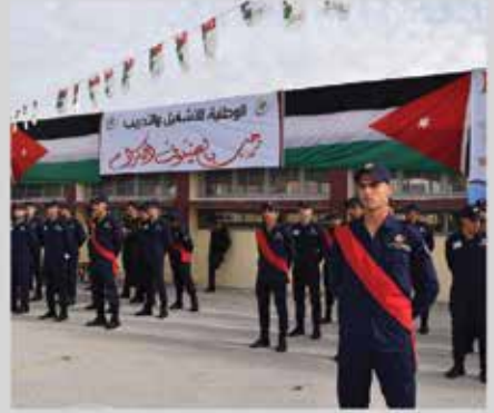
تخريج متدربي معهد ماركا الصناعي