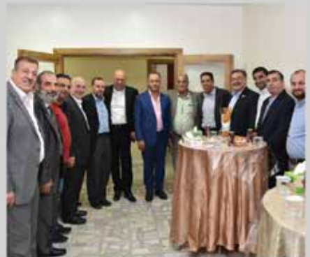
انتخابات مجلس إدارة الجمعية للدورة الثالثة