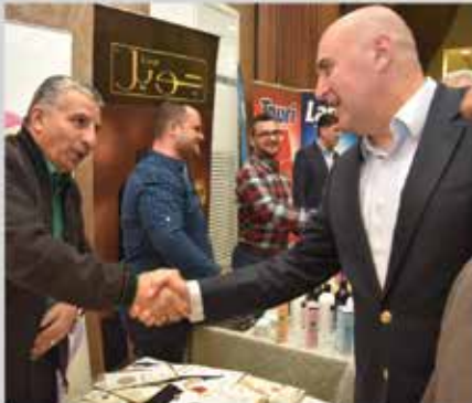
مؤتمر واقع الصناعة ومستقبل التغيير ومعرض المنتجات المرافق