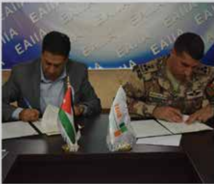
توقيع مذكرة تفاهم بين الجمعية و الشركة الوطنية للتشغيل والتدريب