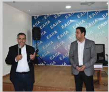
استضافة الوفد الأثيوبي التجاري في الجمعية