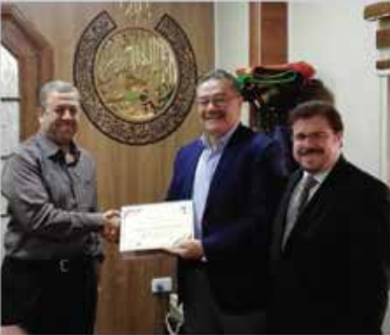
زيارة عضو الجمعية - الدولية للصناعات البلاستيكية