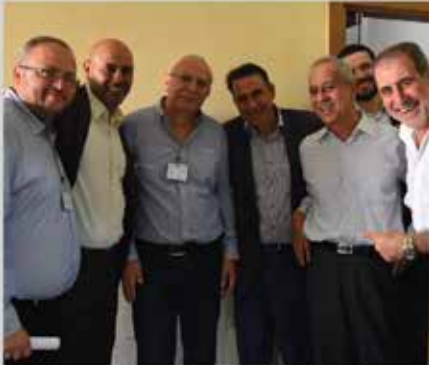
انتخابات مجلس إدارة الجمعية للدورة الثالثة