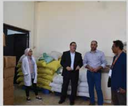
زيارة أعضاء الوفد الأثيوبي لعدد من المصانع في ماركا