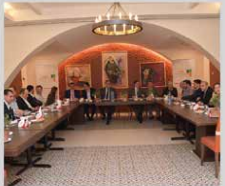
حفل تكريم الداعمين لوحدة دعم التشغيل