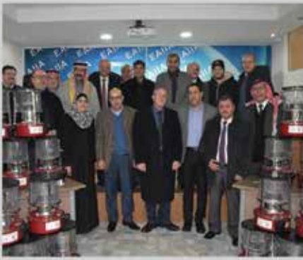
المسؤولية المجتمعية - توزيع صوبات لقاعات امتحانات طلبة التوجيهي - ماركا