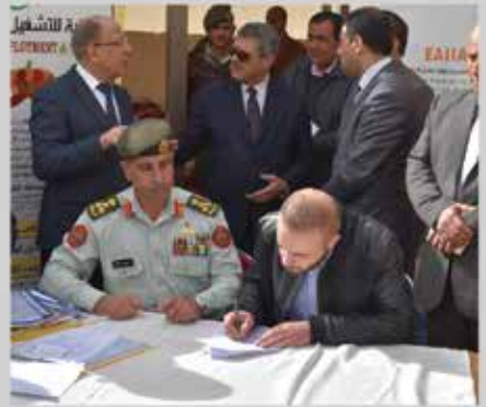
توقيع اتفاقيات تشغيل متدربي المعهد