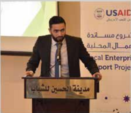
مؤتمر واقع الصناعة ومستقبل التغيير