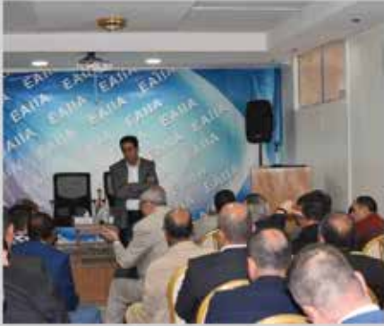
استضافة الوفد الأثيوبي التجاري في الجمعية