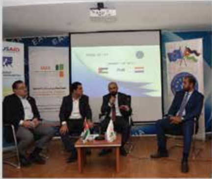
ورشة التعريف ببرنامج الخبراء الهولنديين Pum وبرنامج Jade