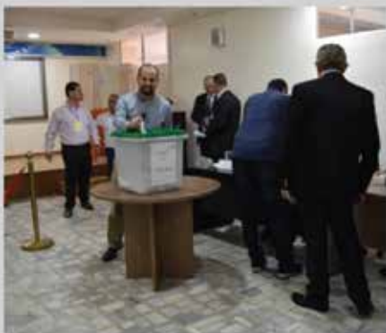
انتخابات مجلس إدارة الجمعية للدورة الثالثة