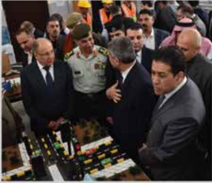
تخريج متدربي معهد ماركا الصناعي