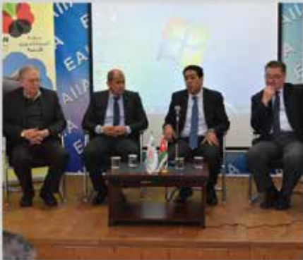
لقاء مدير الغذاء مع الصناعيين - شرق عمان