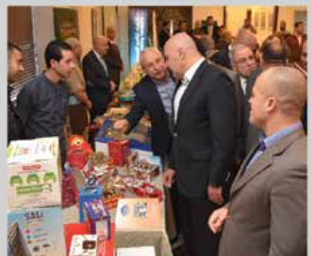
مؤتمر واقع الصناعة ومستقبل التغيير ومعرض المنتجات المرافق