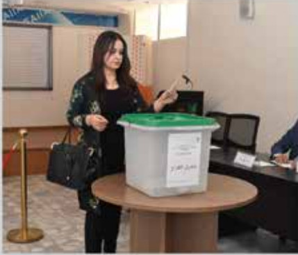
انتخابات مجلس إدارة الجمعية للدورة الثالثة