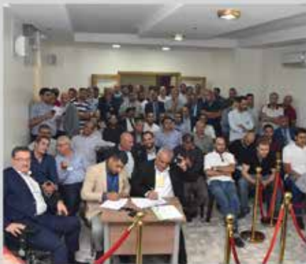
انتخابات مجلس إدارة الجمعية للدورة الثالثة