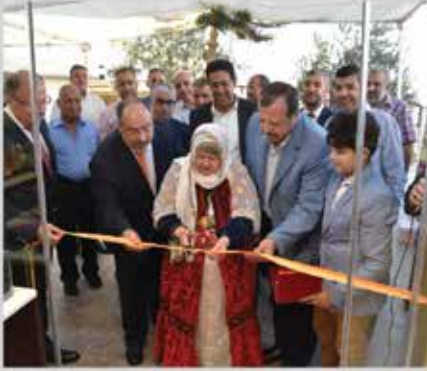
افتتاح معرض الشركة العالمية للشوكولاتة