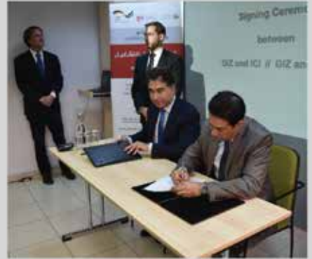
توقيع اتفاقية دعم وحدة التشغيل برنامج التجارة من أجل التشغيل T4E