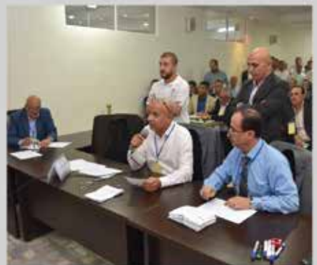
انتخابات مجلس إدارة الجمعية للدورة الثالثة