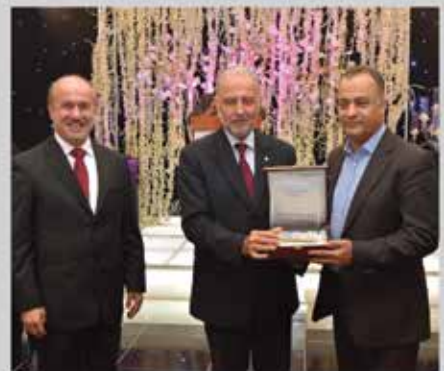
تكريم الجمعية - المشاركة في معرض الرخاء الدولي