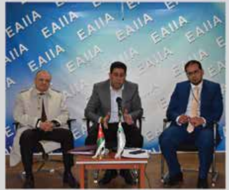
لقاء إدارة جمعية المحاسبين مع الصناعيين