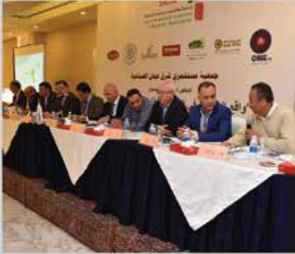
اجتماع الهيئة العامة الثامن - شرق عمان