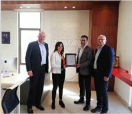
زيارة مصانع بن العميد