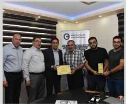
زيارة عضو الجمعية - مسكبة الشرق الأوسط