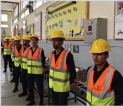
تخريج متدربي معهد ماركا الصناعي