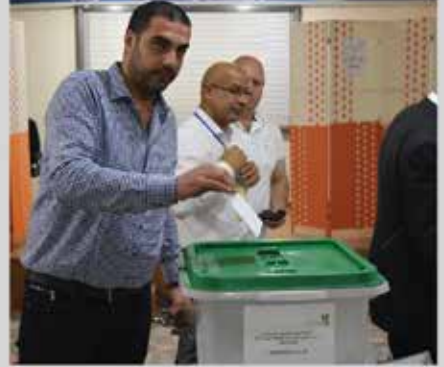
انتخابات مجلس إدارة الجمعية للدورة الثالثة