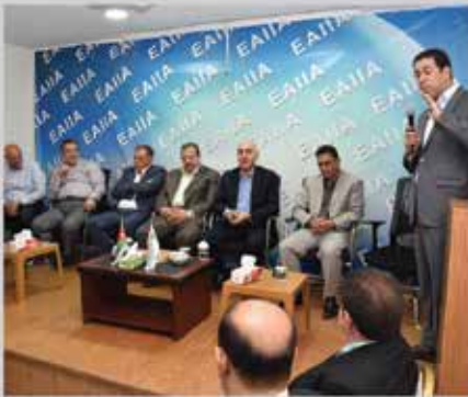
لقاء عطفة متصرف لواء ماركا مع الصناعيين