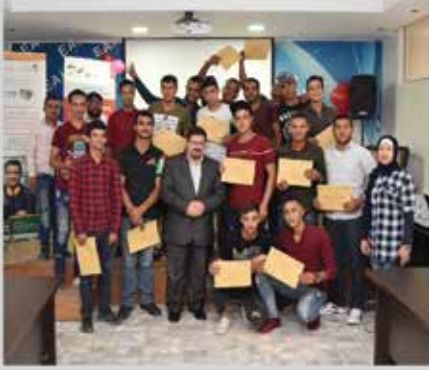
تخريج دورة مهارات الاتصال