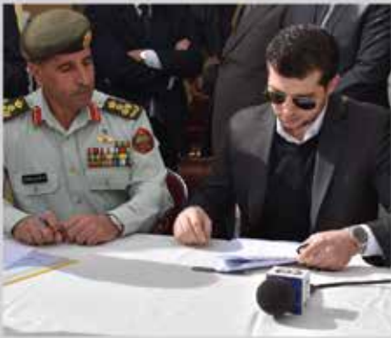
توقيع اتفاقيات تشغيل متدربي المعهد