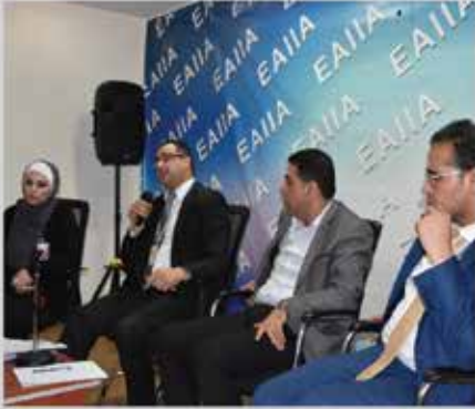
ورشة حول مستجدات قانون الضمان الإجتماعي