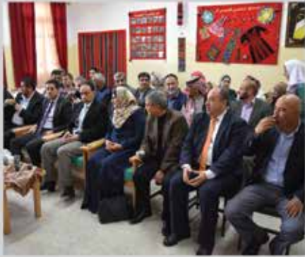
المسؤولية المجتمعية - تقديم المساعدات للطلبة الفقراء - مدرسة الحكمة الابتدائية ماركا