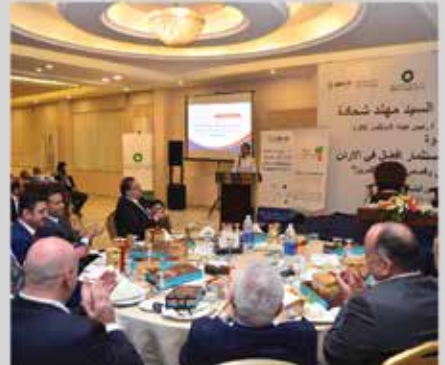
مؤتمر واقع الصناعة ومستقبل التغيير