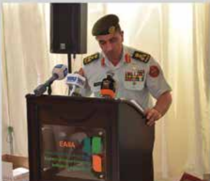
معرض التشغيل الصناعي الثالث - شرق عمان