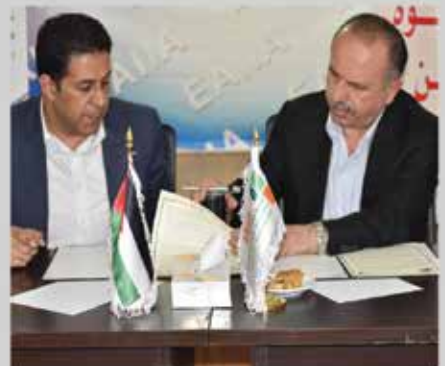
توقيع مذكرة تفاهم بين الجمعية وجمعية مستثمري مدينة الموقر الصناعية