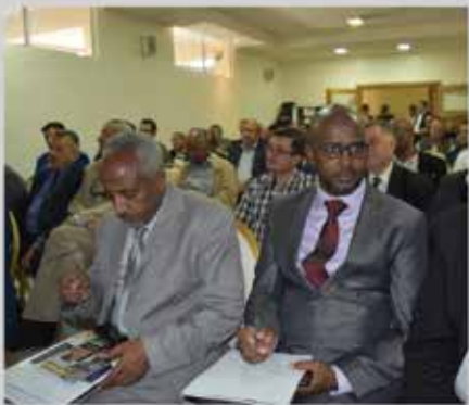
استضافة الوفد الأثيوبي التجاري في الجمعية