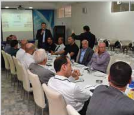
انتخابات مجلس إدارة الجمعية للدورة الثالثة