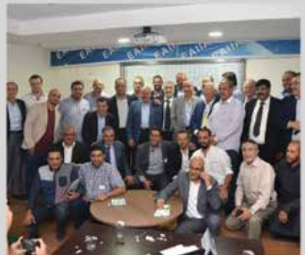
انتخابات مجلس إدارة الجمعية للدورة الثالثة