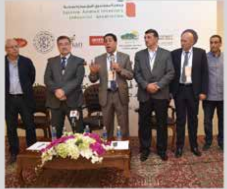
اجتماع الهيئة العامة الثامن - شرق عمان