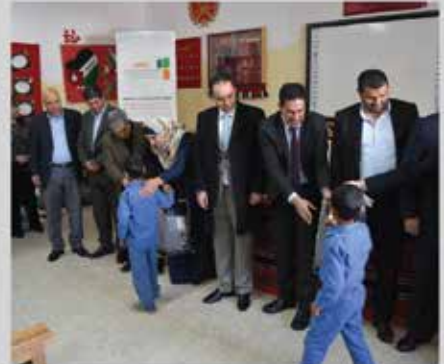
المسؤولية المجتمعية - تقديم المساعدات للطلبة الفقراء - مدرسة الحكمة الابتدائية ماركا