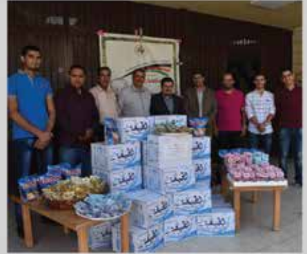
المسؤولية المجتمعية - توزيع مياه لقاعات امتحانات طلبة التوجيهي - ماركا