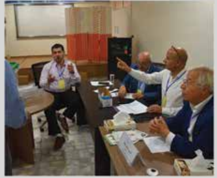
انتخابات مجلس إدارة الجمعية للدورة الثالثة