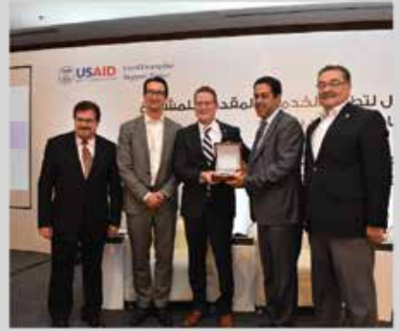
تكريم الجمعية - حفل اختتام برنامج مساندة المشاريع الاقتصادية - Cipe