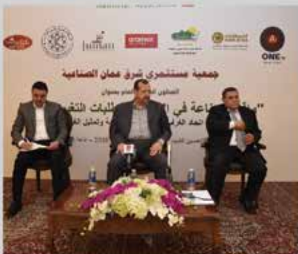
مؤتمر واقع الصناعة ومستقبل التغيير