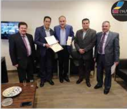
زيارة عضو الجمعية - الشركة المتطورة للأثاث