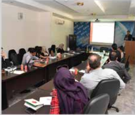
استضافة خبراء برنامج التجارة من أجل التشغيل مكتب - مصر