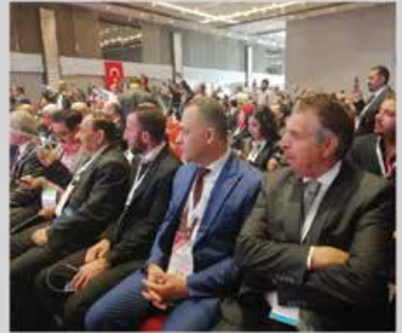
المشاركة في مؤتمر ومعرض ( تراب ) - اسطنبول