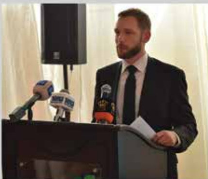
معرض التشغيل الصناعي الثالث - شرق عمان