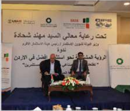
مؤتمر واقع الصناعة ومستقبل التغيير