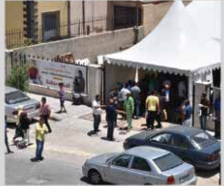
معرض التشغيل الصناعي الثالث - شرق عمان