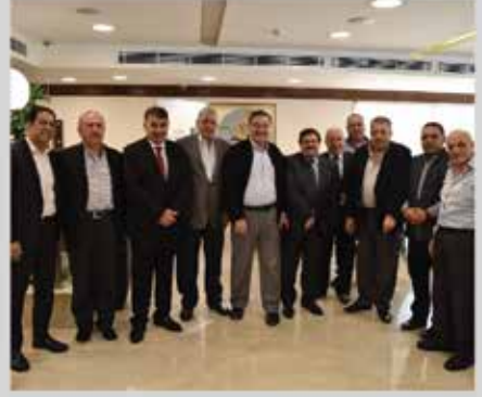
حفل افتتاح مطاعم المحيط - عضو الجمعية استضافة أعضاء الجمعية