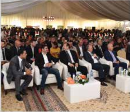
معرض التشغيل الصناعي الثالث - شرق عمان