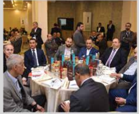
مؤتمر واقع الصناعة ومستقبل التغيير