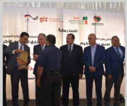
معرض التشغيل الصناعي الثالث - شرق عمان