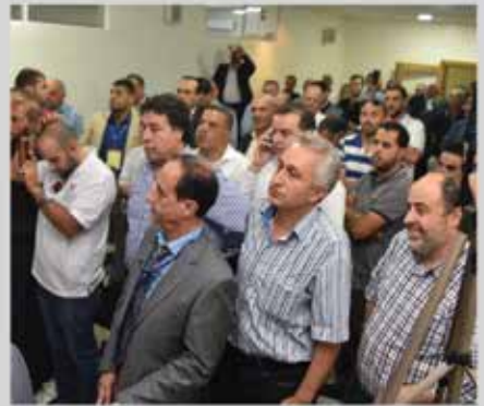
انتخابات مجلس إدارة الجمعية للدورة الثالثة