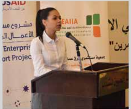
مؤتمر واقع الصناعة ومستقبل التغيير